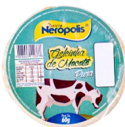
Geleinha de Mocotó 60g: Cód. Interno: 299 Barras: 7898043112377 NCM: 20079910 Qtd. por Caixa: 24