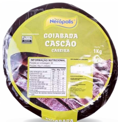
Goiabada Cascão 1kg: Cód. Interno: 133 Cód. Barras: 7898043112209 NCM: 20079990 Qtd. por Caixa: 5