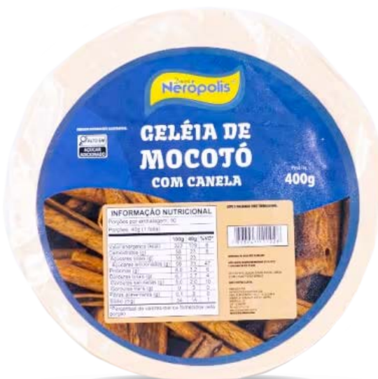
Geléia de Mocotó com Canela 400g: Cód. Interno: 127 Cód. Barras: 7898043111028 NCM: 20079910 Qtd. por Caixa: 12