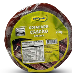
Goiabada Cascão 250g: Cód. Interno: 304 Cód. Barras: 7898043113428 NCM: 20079990 Qtd. por Caixa: 18