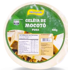
Geléia de Mocotó Pura 400g: Cód. Interno: 88 Cód. Barras: 7898043110847 NCM: 20079910 Qtd. por Caixa: 12