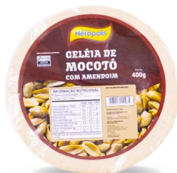
Geléia de Mocotó com Amendoim 400g: Cód. Interno: 128 Cód. Barras: 7898043111035 NCM: 20079910 Qtd. por Caixa: 12