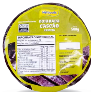
Goiabada Cascão 500g Cód. Interno: 580 Cód. Barras: 7898043112193 NCM: 20079990 Qtd. por Caixa: 12